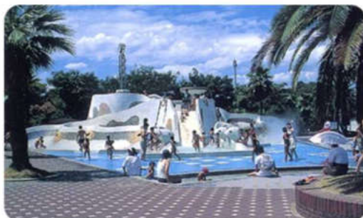
総面積10000m 2 の水遊び設備が整った遊園広場。